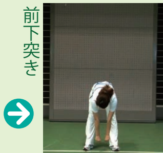
膝を伸ばし、前屈しながら両拳で前方下を突きます。