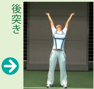
元の姿勢に戻り、上体を反らしながら両拳で後上を突きます。