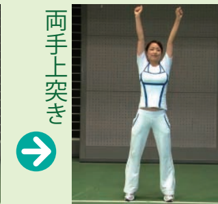
最後に、体を反らさず踵をあげて真上を突きます。