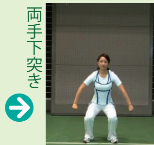
次は肘を開いて両拳を下に向け、膝を曲げながら下を突きます。