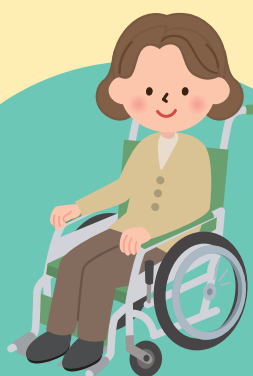
重度障がい者医療