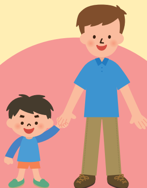
ひとり親家庭医療